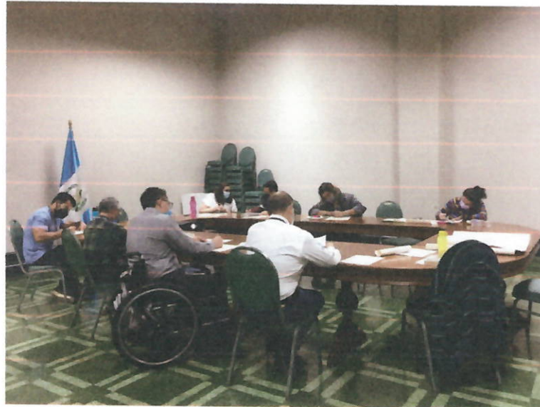
Imagen 1: Validación de Taller Participativo de Patrimonio Cultural Intangible.