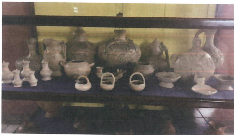
Imagen 3: Coordinación para exposición en Pasaje Sexta del Palacio Nacional de la Cultura.